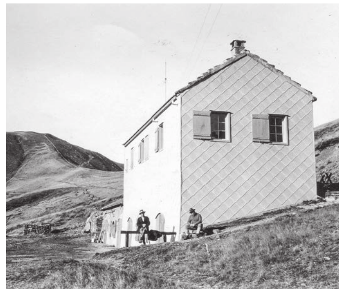
Nel luglio del 1926 la sopraelevazione dell'antico barco è terminata.