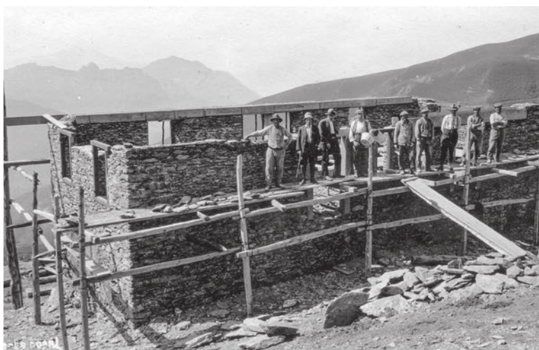
Il cantiere in piena attività per adattare l'alpeggio alle esigenze dei boscaioli impegnati nella realizzazione delle piantagioni.

alla manutenzione delle opere di premunizione dai pericoli naturali. In realtà, gli anni cruciali sono due: il 1924, quando è stato sottoscritto l'atto di compra-vendita, datato 21 ottobre, per un valore di 12mila franchi; e il 1926, quando l'antico barco adibito al ricovero del bestiame, all'alloggio del personale e alla produzione del formaggio è stato parzialmente adattato alla nuova funzione di casa forestale.