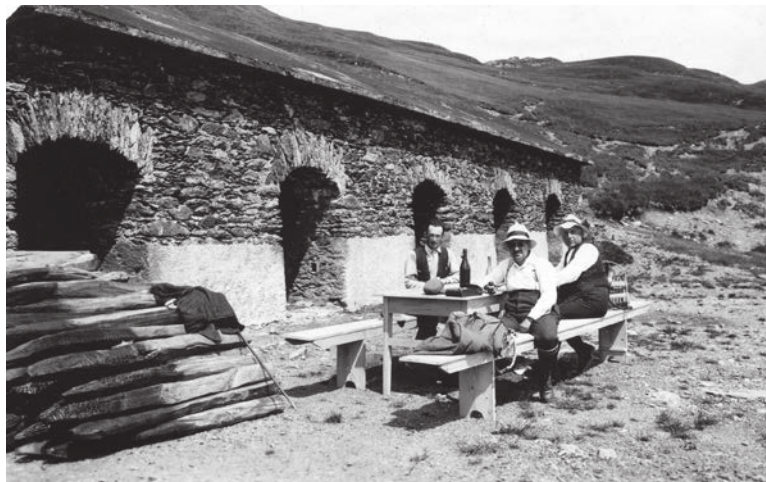
Il vecchio alpeggio di proprietà del Patriziato di Sala Capriasca fu ceduto all'allora Consorzio dell'Alto Cassarate per 12mila franchi.

Piandanazzo non era l'unica proprietà del consorzio, che in quegli anni acquisì dai patriziati altre proprietà. È il caso degli alpi Ladrin e Matro, rivolti verso la Valle Serdena, incassando l'affitto dagli allevatori che li caricavano con il loro bestiame. Amministrate dal Consorzio Valle del Cassarate, oggi le caschine – compresa la Spessa, presidio strategico nel cuore delle piantagioni – sono locate a privati che le utilizzano come rifugio di montagna.