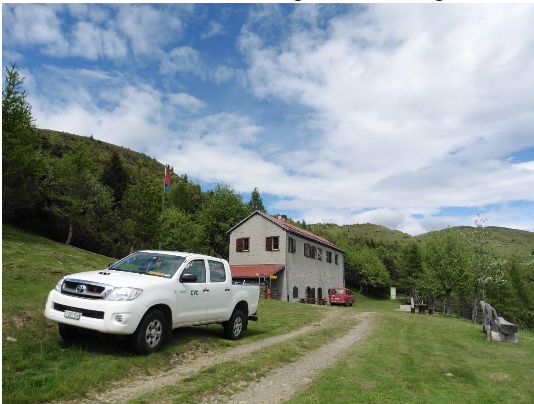
Piandanazzo, giugno 2016