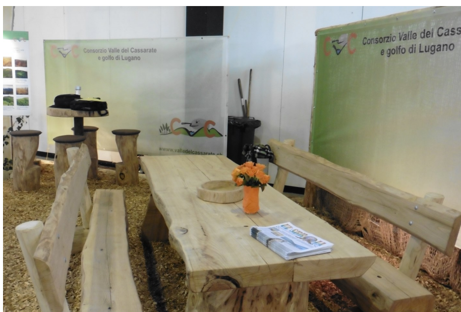
Stand CVC, FloraLugano & BoscoTicino 2017