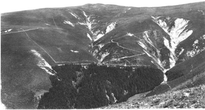
Zona Rompiago anni 1940

Il progetto prevede un investimento totale di fr. 9'890'000, di cui fr. 4'747'000 direttamente a Carico del Cantone e si svilupperà sull'arco di 15 anni (2018-2032).