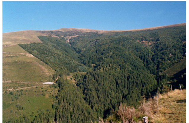
Zona Rompiago anni 2000