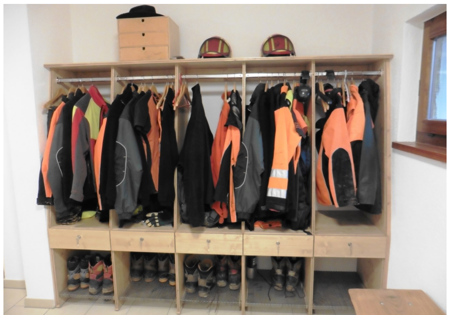
Dettaglio spogliatoio, Magazzino di Lugaggia.

La squadra operativa del CVC ha ora una base logistica più funzionale e accogliente. A gennaio 2016 si sono infatti conclusi i lavori di miglioramento al magazzino di Lugaggia, iniziati a ottobre 2015 su progetto dell'arch. Raoul Gianinazzi di Tesserete. Gli operai ora dispongono di un nuovo bagno, una doccia e uno spogliatoio corredato da armadietti per riporre abiti ed effetti personali. Altri lavori hanno riguardato la parte esterna del magazzino, in particolare con la realizzazione di una rimessa in cui stoccare in modo efficiente mezzi ed attrezzi.