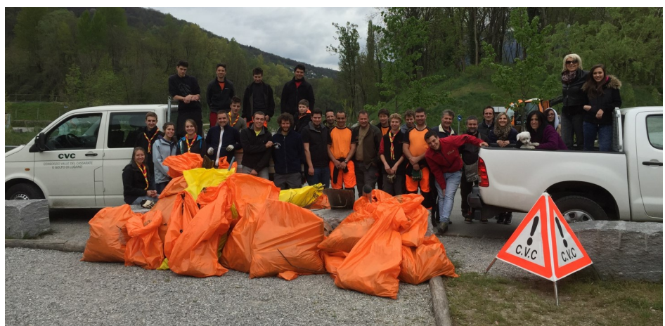
Piano Stampa, Ponte del Bocciodromo, 19.04.2015: foto di tutti i partecipanti dopo la raccolta comune dei rifiuti.

L'iniziativa verde, con la sua azione di stimolo e sensibilizzazione, oltre a formare una cultura e una coscienza ambientale, contribuisce alla nascita di parchi locali, con una ricaduta positiva di riappropriazione e conoscenza del territorio.