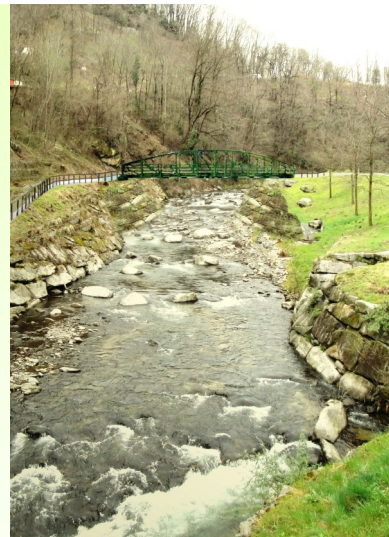
Ricostruzione fotografica del fiume Cassarate presso il Ponte di Valle a lavori eseguiti, con la posa della passerella ex Parco Ciani. Progetto Luigi Tunesi, Ingegneria SA, Lugano Pregassona, 2015.