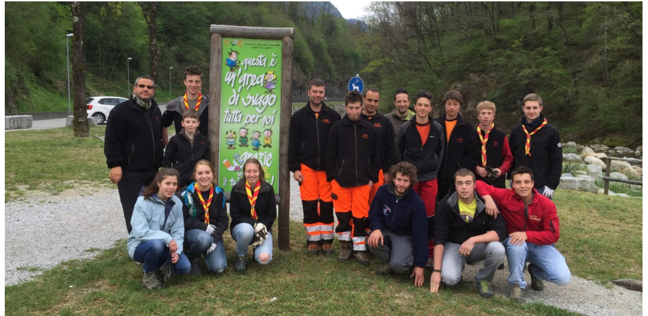
Piano Stampa, Ponte del Bocciodromo, 19.04.2015: foto di tutti i partecipanti prima della raccolta comune dei rifiuti.