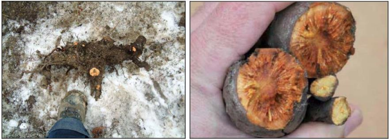
Figura 3 – rizomi di Poligono del Giappone . A sinistra, rizoma di grandi dimensioni estratto a ca. 1.5 metri di profondità. A destra, rizomi spezzati (con facilità) d'aspetto simile alle carote.