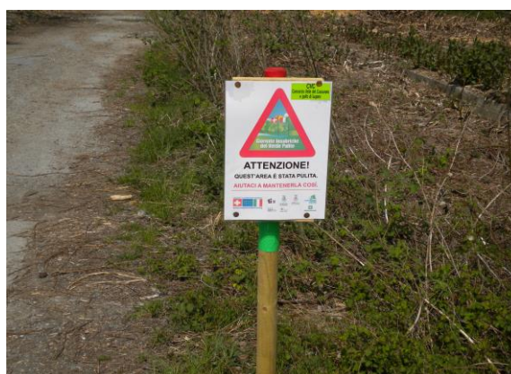
Figura 4 – Giornate di “Verde pulito” con CVC e popolazione del Comune di Canobbio

Chi si impegna nella pulizia dei bordi stradali o delle sponde fluviali deve essere informato su questa pianta: bisogna riconoscerla ed essere al corrente del pericolo